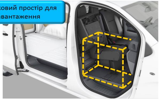
Додатковий простір для завантаження