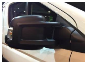
↑ стандартні зовнішні дзеркала.