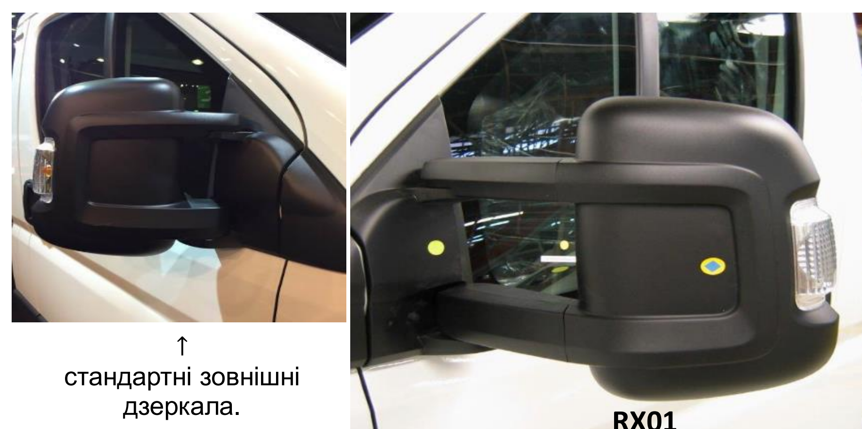
↑ стандартні зовнішні дзеркала.