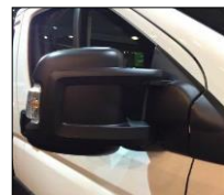
↑ стандартні зовнішні дзеркала.